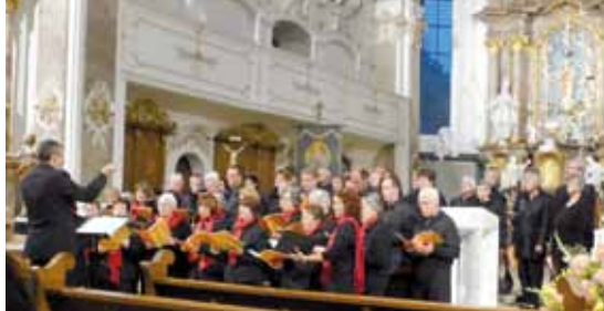
Auftritt in der Schlosskirche in Erbach

Falsch! Ein Kirchenchor begleitet vor allem die Hochfeste des Kirchenjahres,